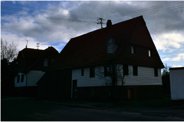
Haus Nr. 54 vor Abbruch (Kappler)