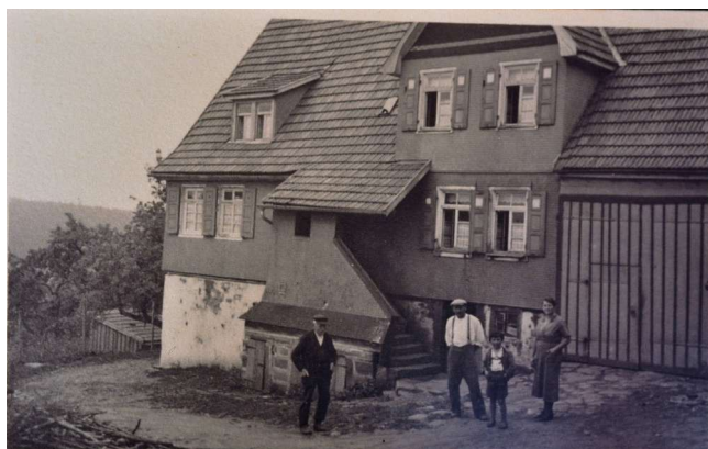
Haus Nr. 18 - (Bohnenberger)

Versicherungsanschlag: (Gulden) 2800 + 300