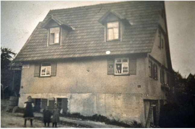
Haus Nr. 44 (Reule, Gemischtwaren)