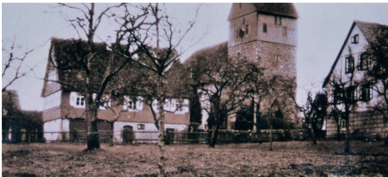
altes Rathaus (Schule) mit Kirche, rechts haus Nr. 42

Bemerkung: 1894 als Rathaus benutzt -Lageplan Baugesuch-