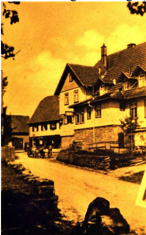
Häuser Nr. 34 Hirsch - Schwitzgäbele