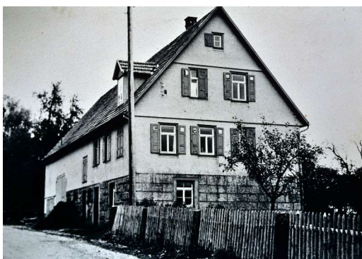
Haus Nr. 42 (David Schlee)