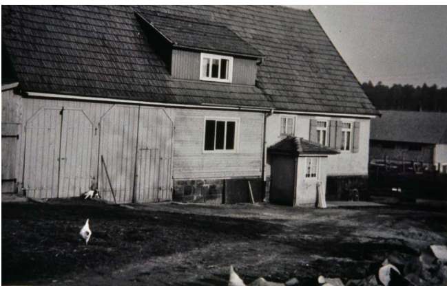
Haus Nr.22 (Kalmbach)