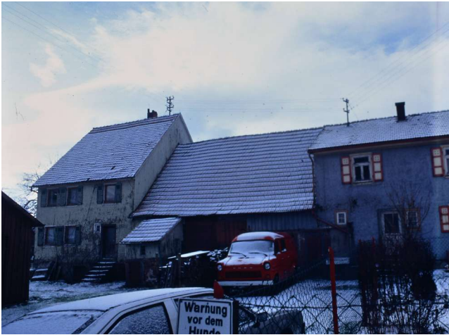
Haus Nr. 30 u 31 (Keppler, Bodamer)