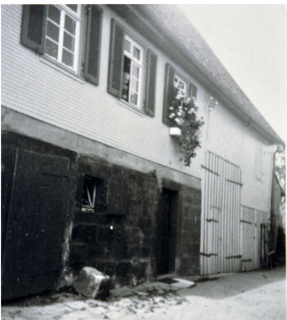
Haus Nr. 24 (Maler Rentschler)