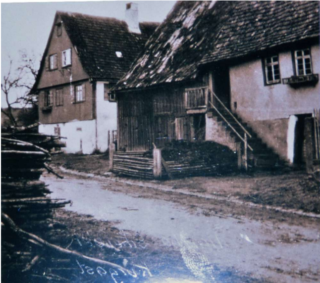
links Haus Nr. 35 – rechts Haus Nr. 36 Kraus, Kussmaul