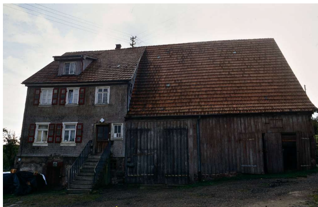
Haus Nr. 25 (Merkle Hölzle)

Versicherungsanschlag: (Gulden) 1500 + 25