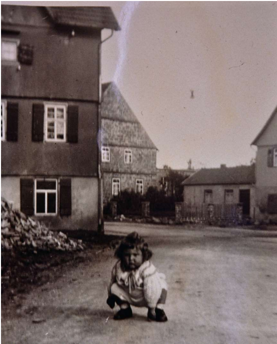
links Haus Nr. 32, beim Einmarsch abgebrannt