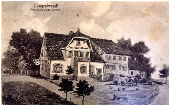
Gasthof Ochsen - Mönch, Reule