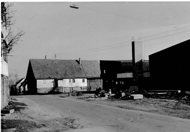
Haus Nr. 3 Fischer