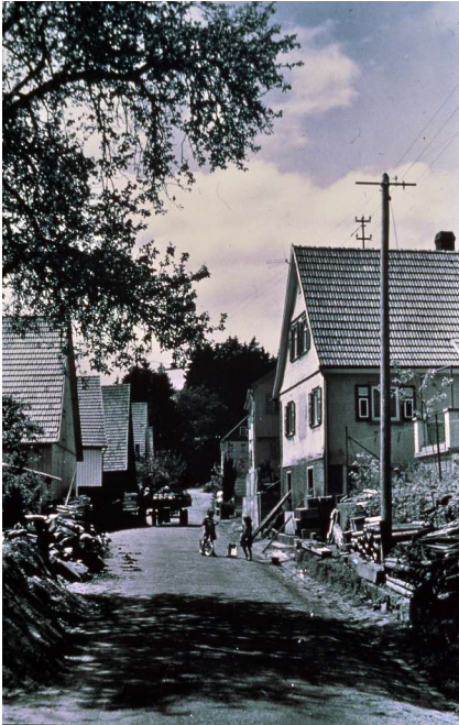
Haus Nr. 59 - Holzgasse