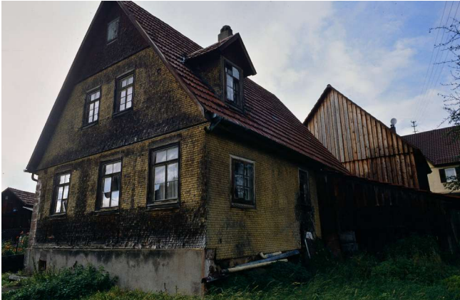
Haus Nr. 21 (Baier)