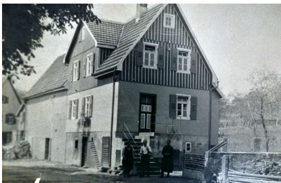
Haus Nr. 7 (Klaile)