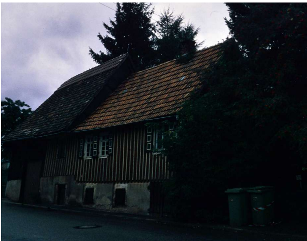
Haus Nr. 49