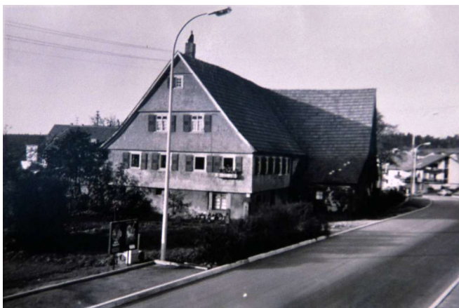
Haus Nr. 4 Wörner

Bemerkung: 1854 wird als Eigentümer von Nr. 4 Matthäus Wankmüller angegeben, mit anderer Beschreibung ?? - weitere Besitzer; Wörner