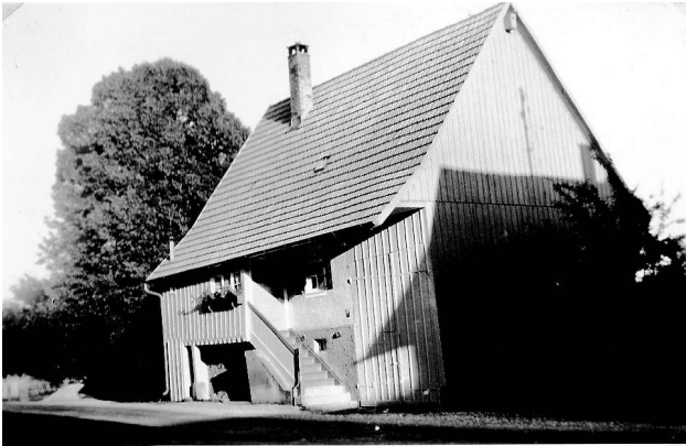
Haus Nr. 56, Bild von 1953