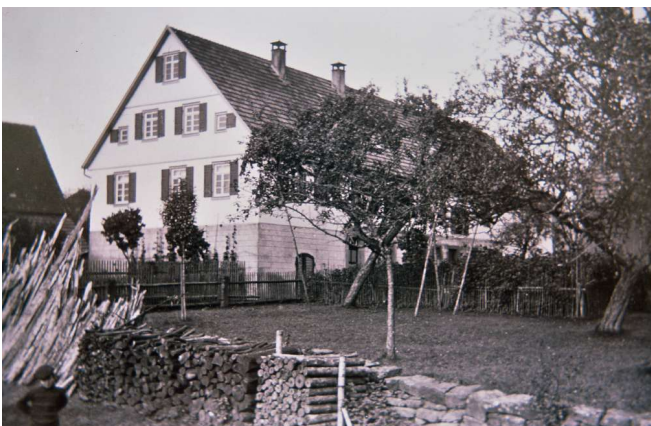
Haus Nr. 38 – Rentschler, Prassler