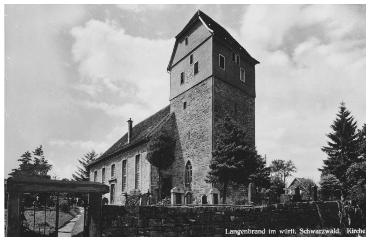
Kirche mit Friedhof

Einrichtung: 14300, Die Orgel: 1800, Die Glocken: 1600, die Uhr: 300