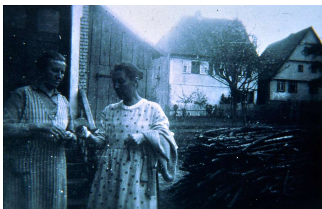
Haus 27 und 62- Häuser Wankmüller